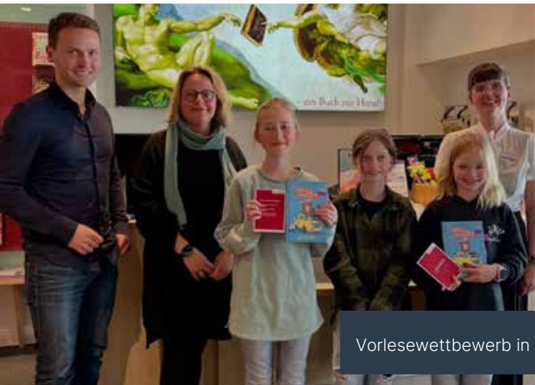
Vorlesewettbewerb in der Buchhandlung Sedlmair