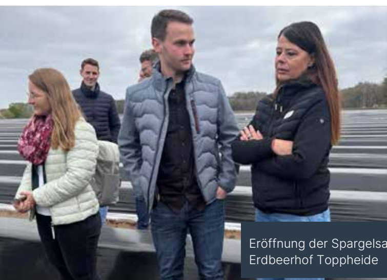
Eröffnung der Spargelsaison beim Spargel- und Erdbeerhof Toppheide