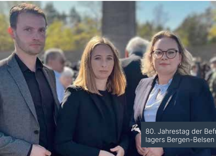
80. Jahrestag der Befreiung des Konzentrationslagers Bergen-Belsen