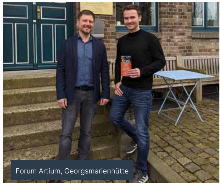
Forum Artium, Georgsmarienhütte