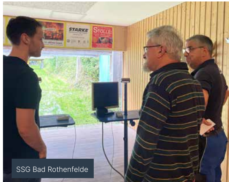
SSG Bad Rothenfelde