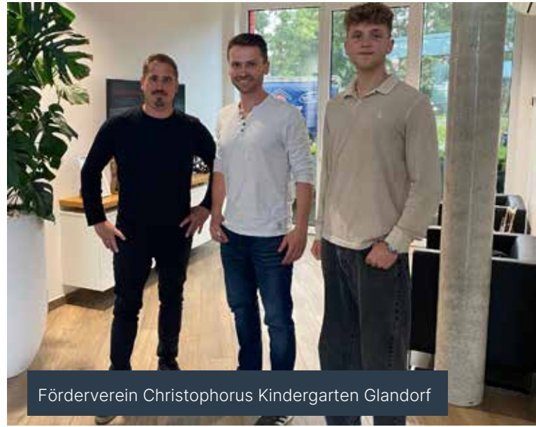
Förderverein Christophorus Kindergarten Glandorf