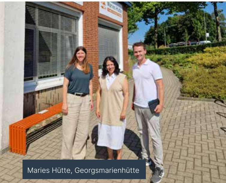
Maries Hütte, Georgsmarienhütte