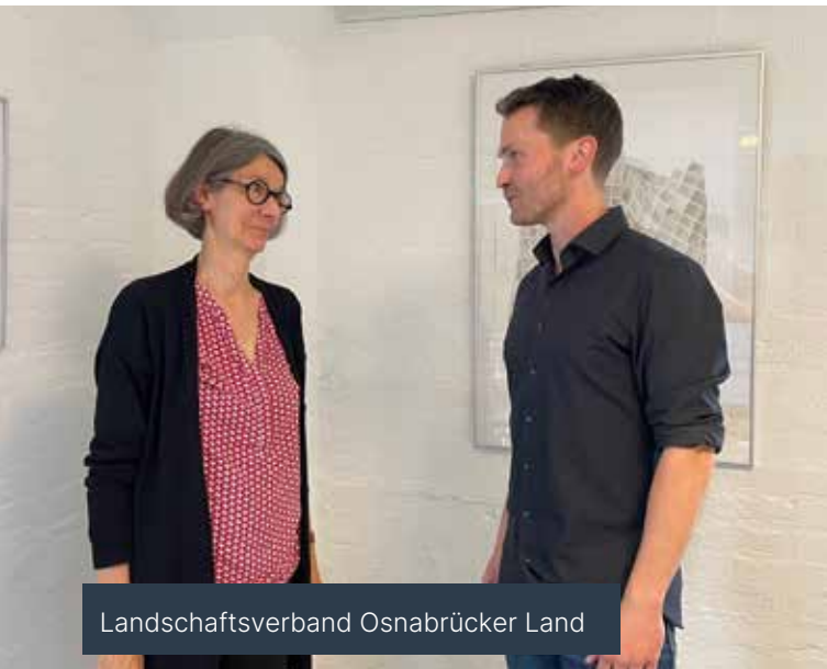
Landschaftsverband Osnabrücker Land