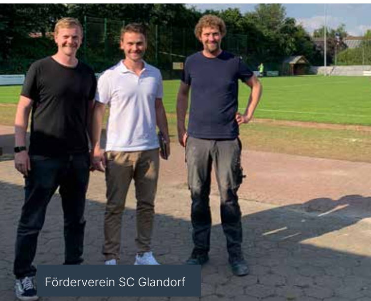
Förderverein SC Glandorf