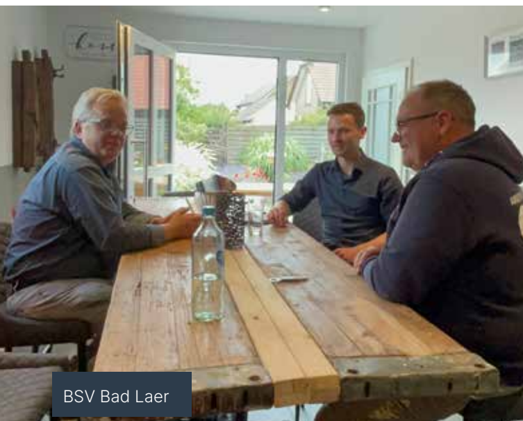
BSV Bad Laer