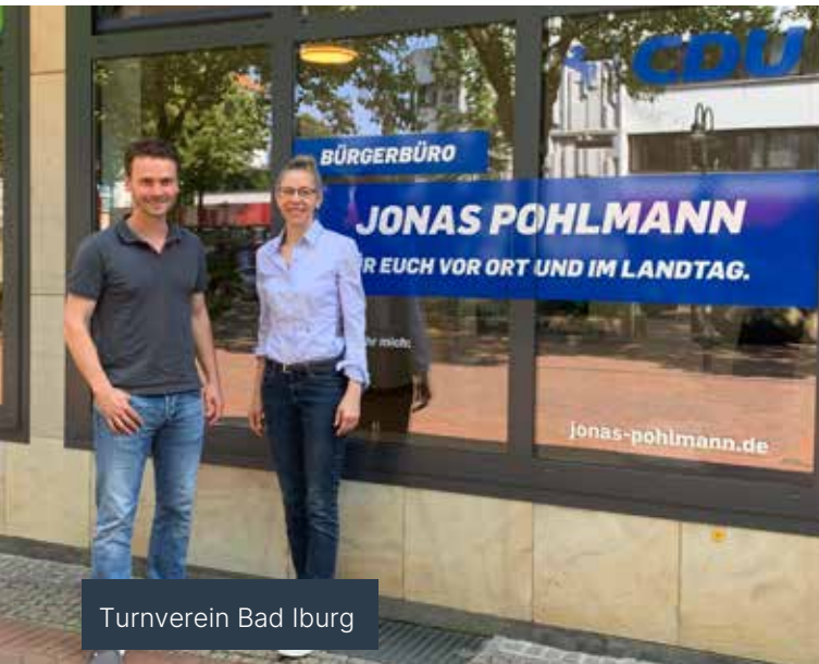
Turnverein Bad Iburg