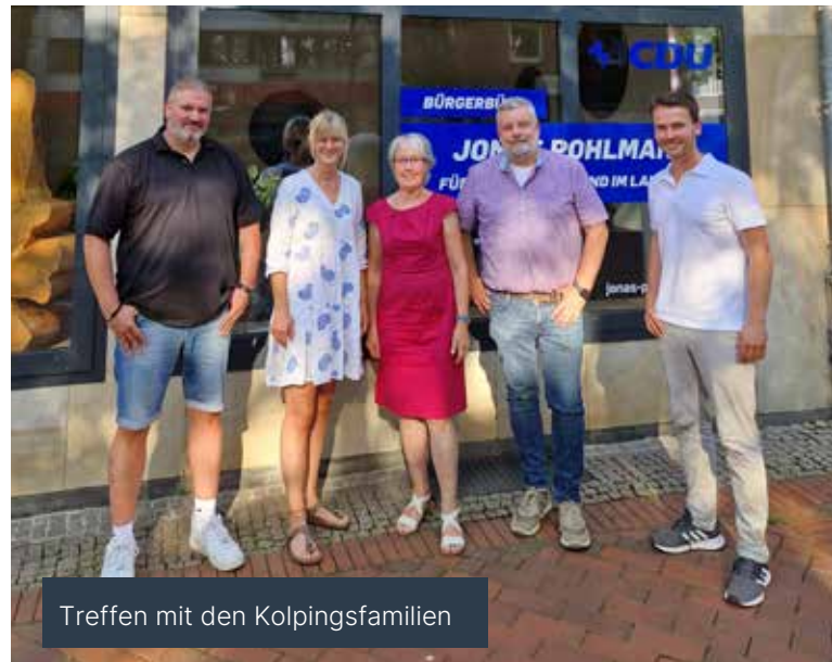
Treffen mit den Kolpingsfamilien