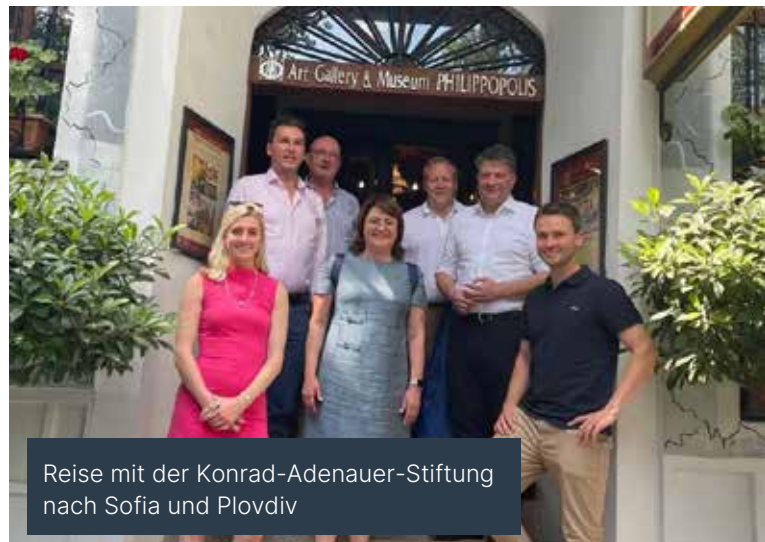
Reise mit der Konrad-Adenauer-Stiftung nach Sofia und Plovdiv