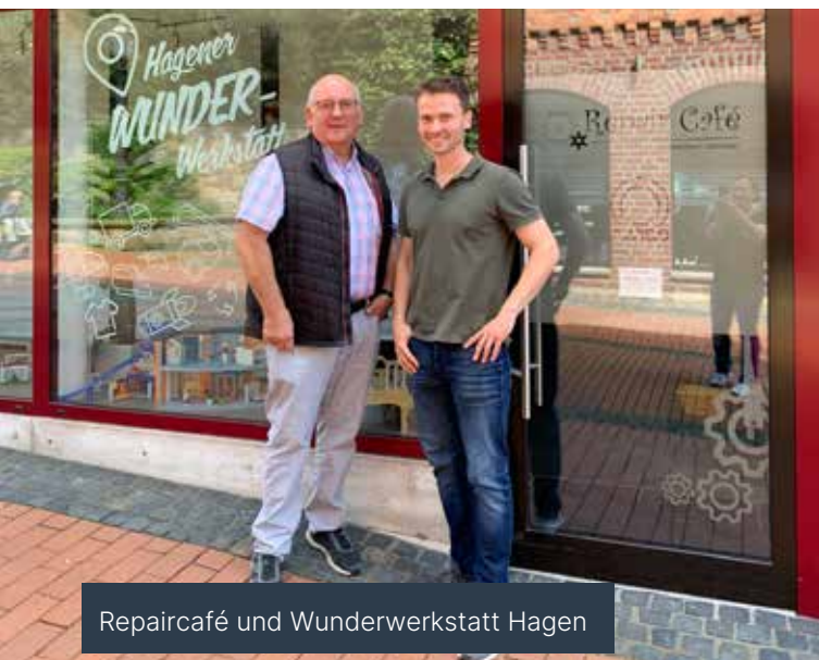
Repaircafé und Wunderwerkstatt Hagen