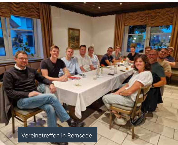
Vereinetreffen in Remsede