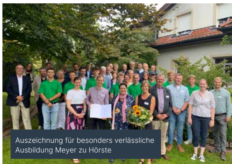
Auszeichnung für besonders verlässliche Ausbildung Meyer zu Hörste