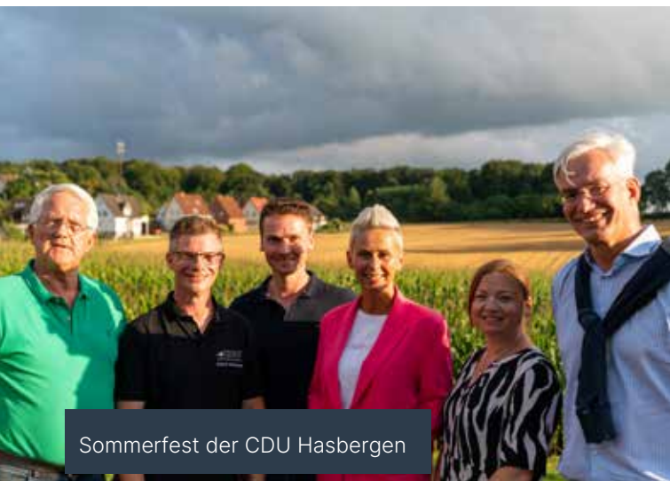
Sommerfest der CDU Hasbergen