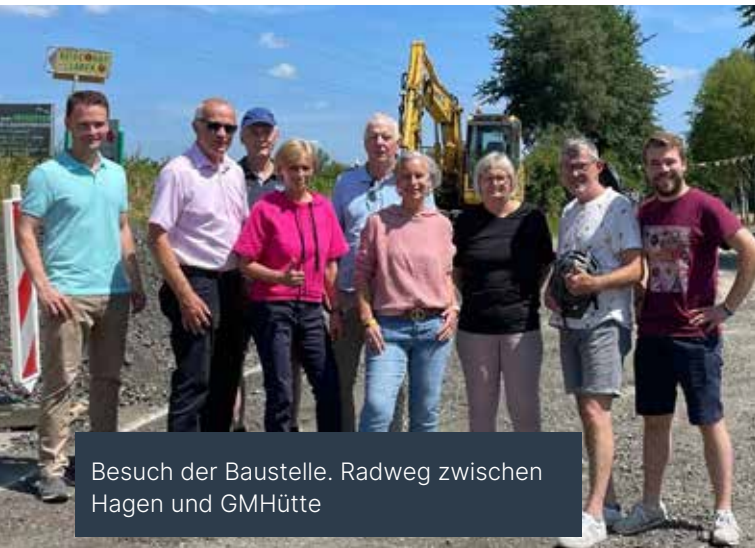
Besuch der Baustelle. Radweg zwischen Hagen und GMHütte