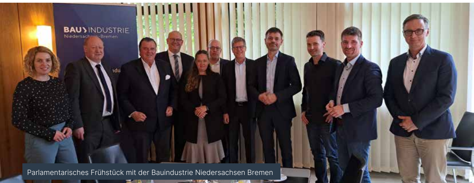
Parlamentarisches Frühstück mit der Bauindustrie Niedersachsen Bremen