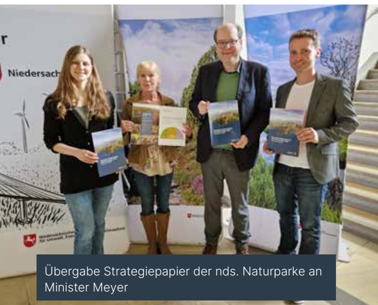
Übergabe Strategiepapier der nds. Naturparke an Minister Meyer