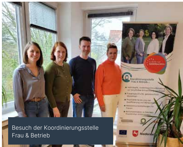
Besuch der Koordinierungsstelle Frau & Betrieb