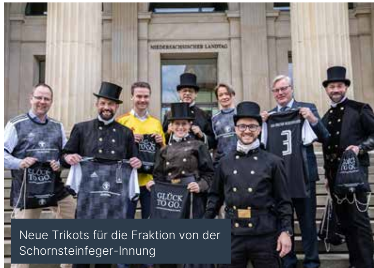
Neue Trikots für die Fraktion von der Schornsteinfeger-Innung