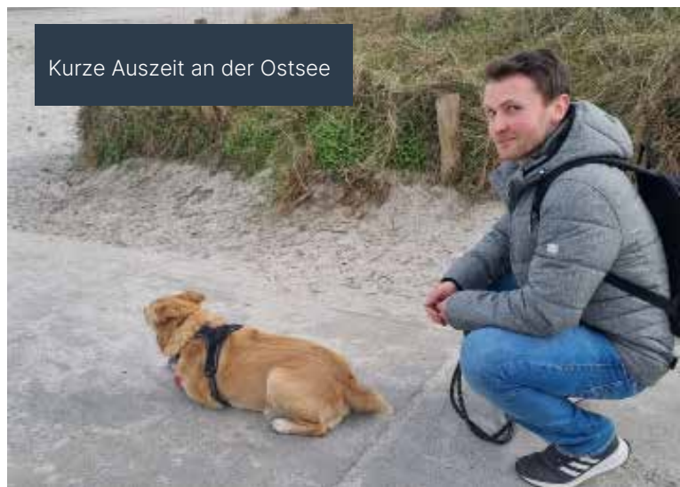
Kurze Auszeit an der Ostsee