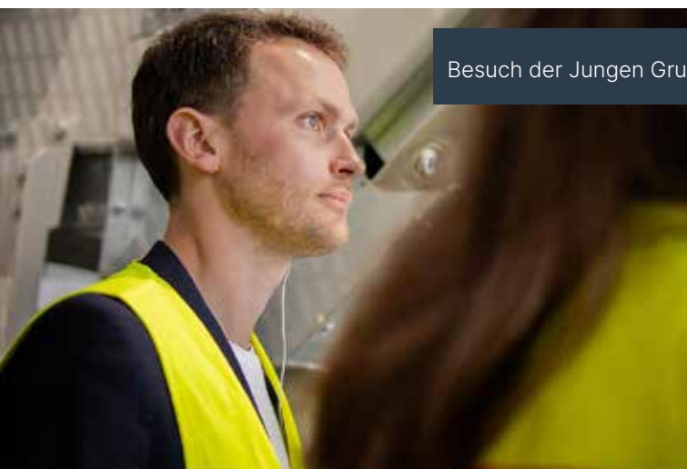
Besuch der Jungen Gruppe des Landtags bei Remondis in Lünen