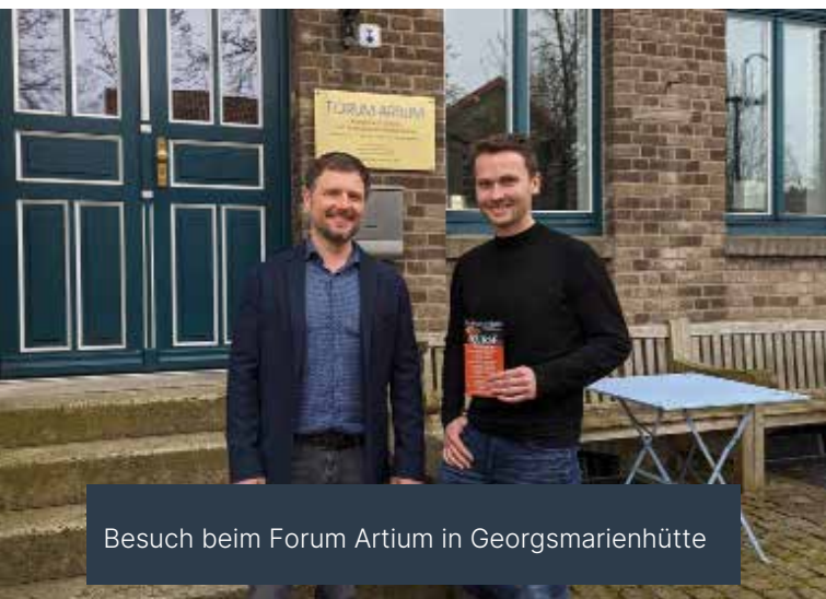
Besuch beim Forum Artium in Georgsmarienhütte