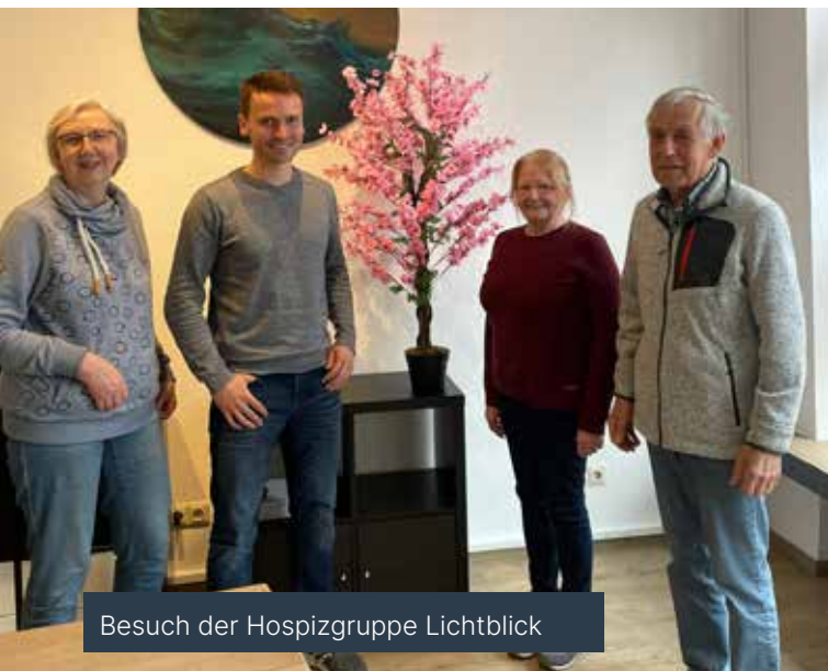
Besuch der Hospizgruppe Lichtblick